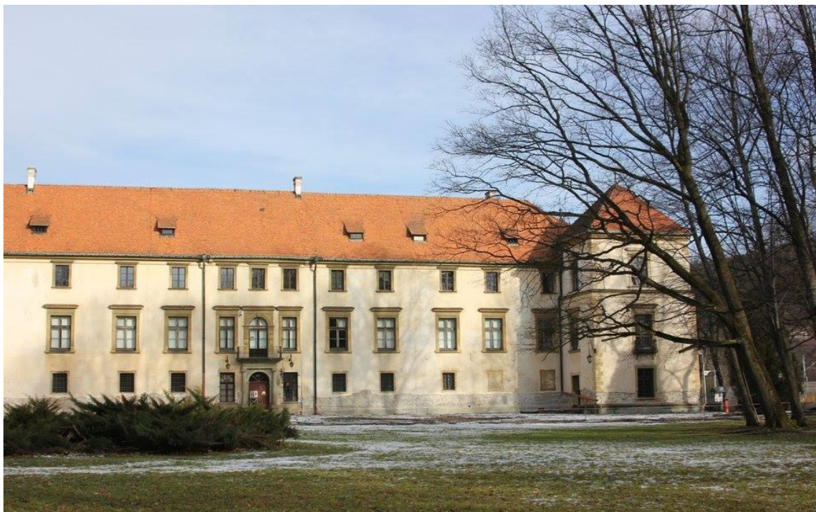
Zamek przed remontem (strona południowa)