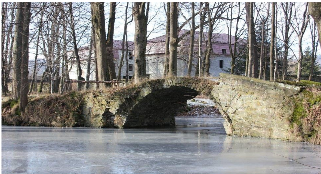
Mostek przed remontem

W parku zamkowym przeprowadzono kompleksowy remont arkadowego mostku, który łączy oba brzegi stawu. Uzupełniono jego konstrukcję, nawierzchnie oraz kamienne elementy architektoniczne wraz ze stylizowanymi łańcuchami, które spełniają rolę barier. Podczas prac poddane zostały renowacji pozostałe, mniejsze mostki znajdujące się w parku zamkowym.