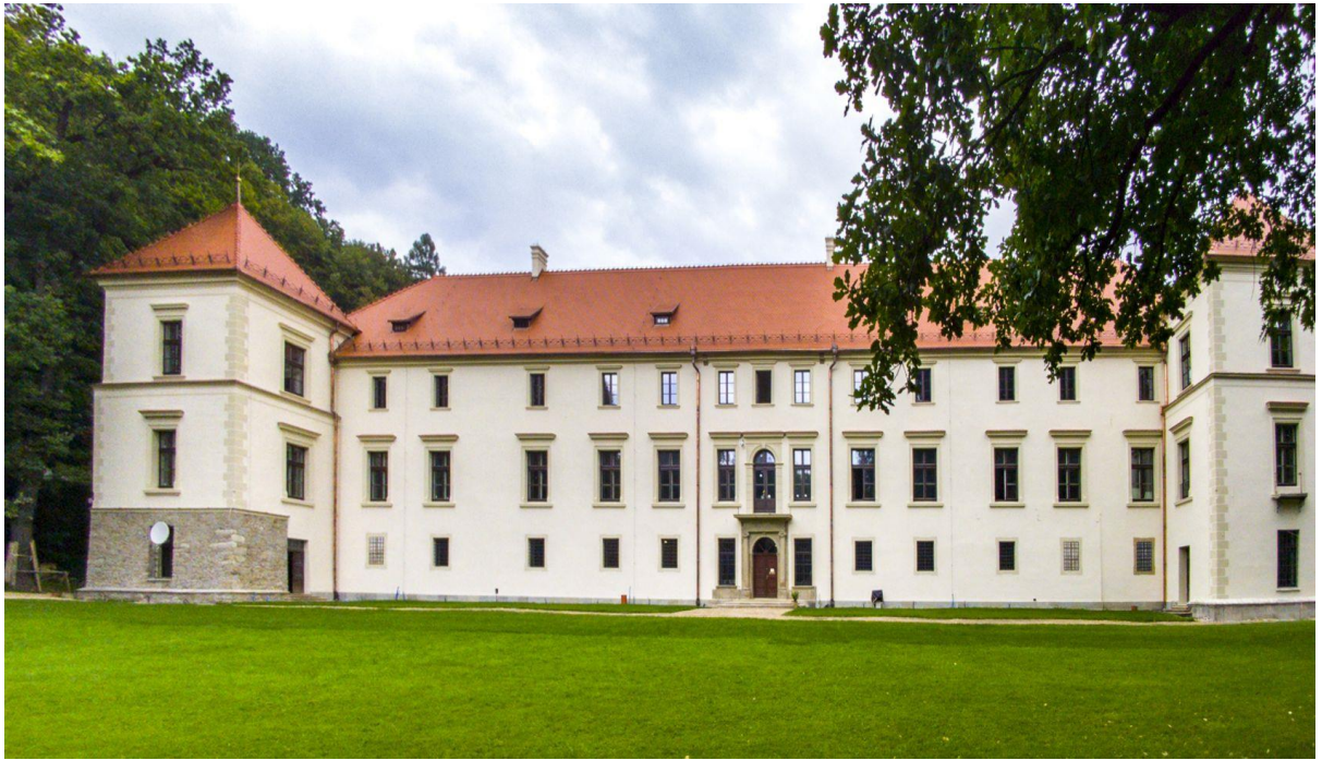
Zamek po remoncie (strona południowa)