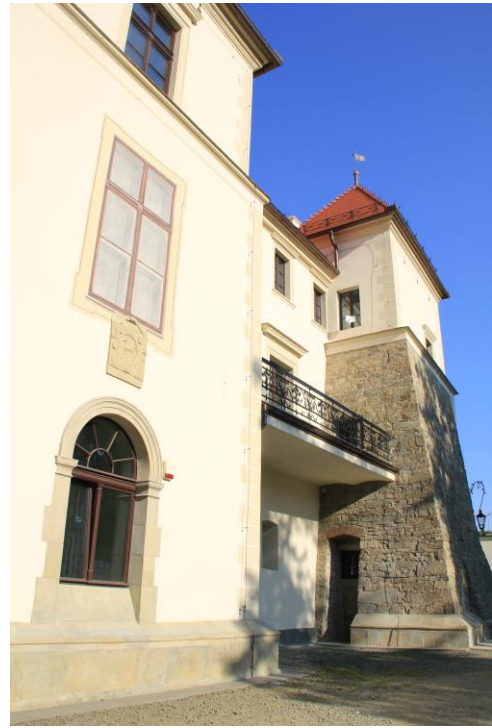
Zamek przed remontem (baszta południowo-wschodnia) Zamek po remoncie (baszta południowo-wschodnia)

W parku zamkowym przeprowadzono kompleksowy remont arkadowego mostku, który łączy oba brzegi stawu. Uzupełniono jego konstrukcję, nawierzchnie oraz kamienne elementy architektoniczne wraz ze stylizowanymi łańcuchami, które spełniają rolę barier. Podczas prac poddane zostały renowacji pozostałe, mniejsze mostki znajdujące się w parku zamkowym.