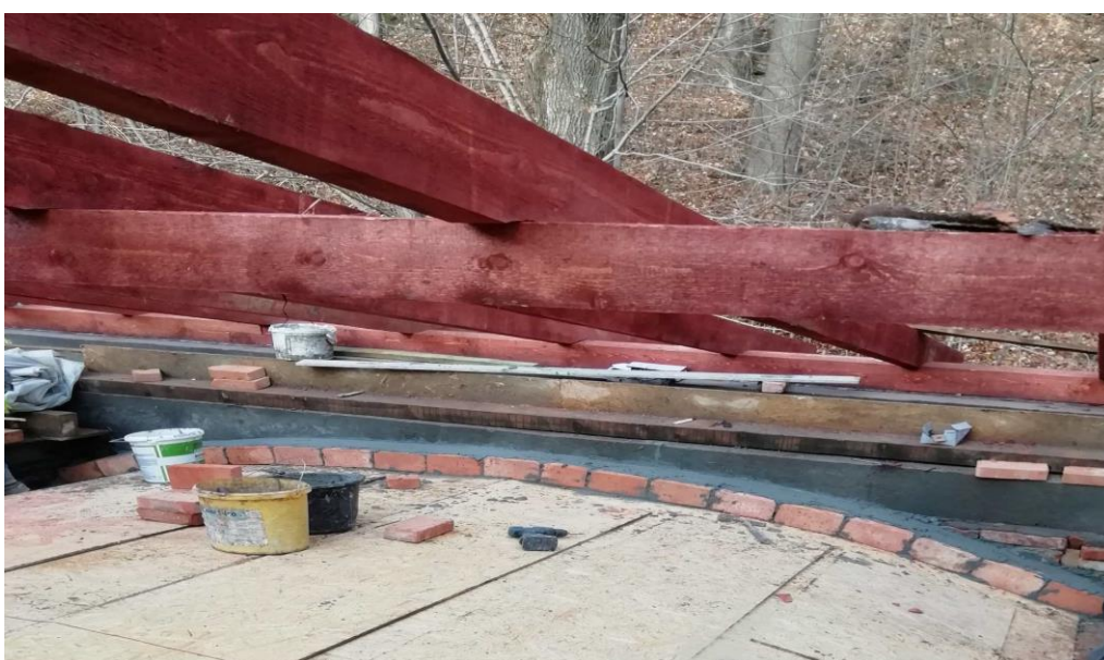
Oranżeria - rekonstrukcja sklepienia