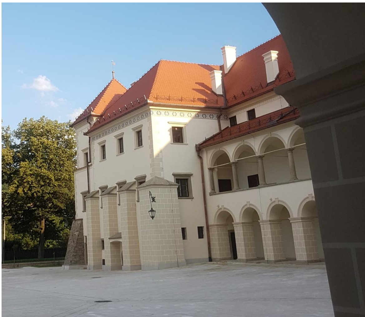
Zamek po remoncie (dziedziniec)