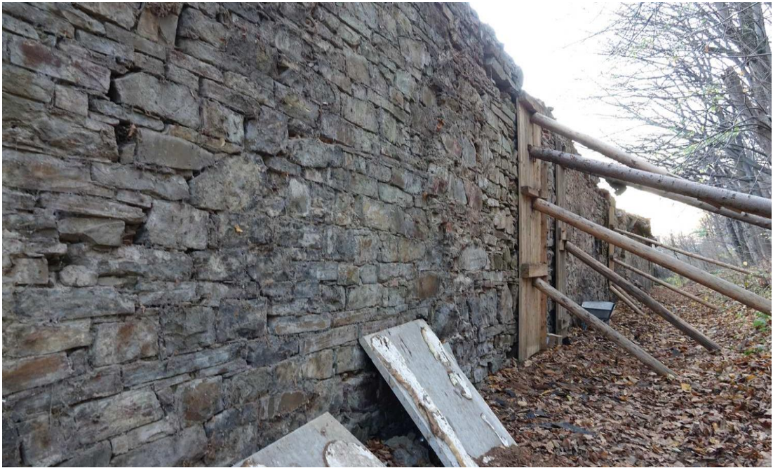
Oranżeria – mur od strony północnej przed jego zabezpieczeniem