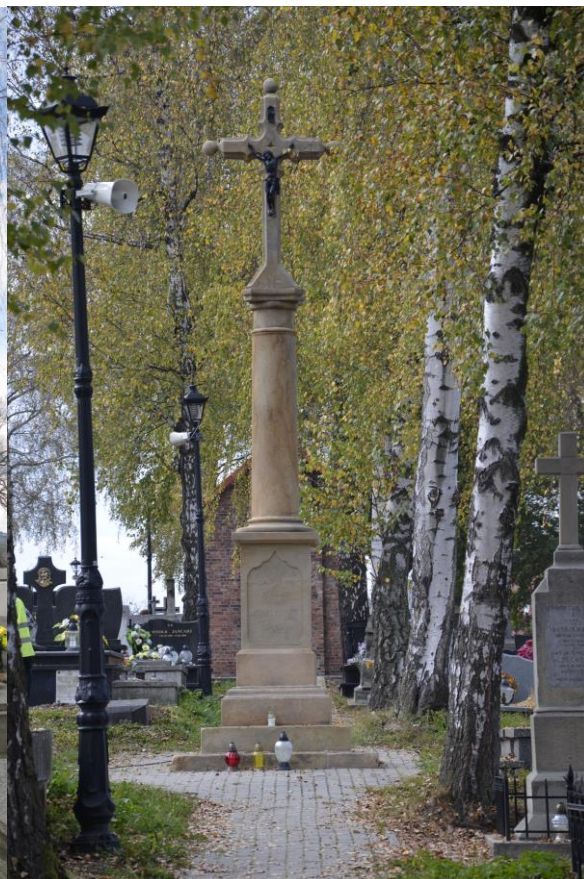
Kapliczka po renowacji