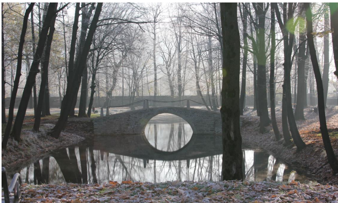
Mostek po remoncie

W roku 2017 opracowane zostało studium historyczne z uwarunkowaniami konserwatorskimi, obejmujące kompleksową rewaloryzację całego obszaru parku zamkowego, wraz z inwentaryzacją zieleni oraz występującymi na jego terenie obiektami (mostki, kanały, oczka basenowe). Studium zawiera także wytyczne konserwatorskie dotyczące rewaloryzacji parku. Koszt wykonania dokumentacji wyniósł 50.000,00 zł.