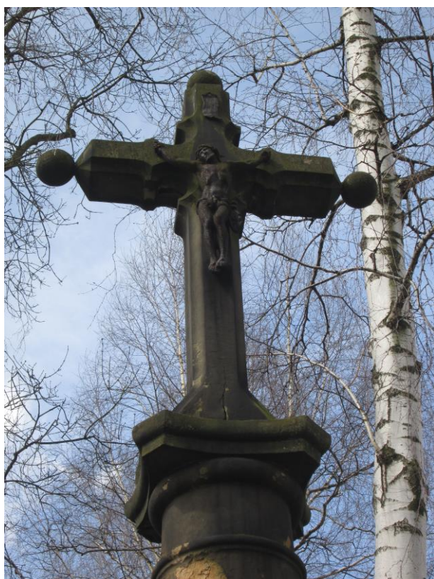
Krzyż przed renowacją