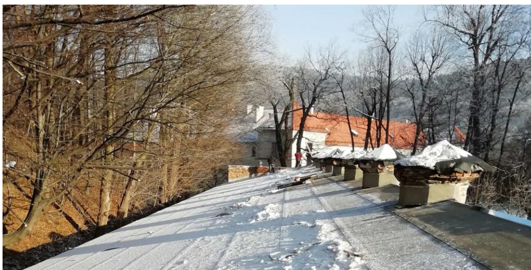
Oranżeria – po wymianie pokrycia dachowego