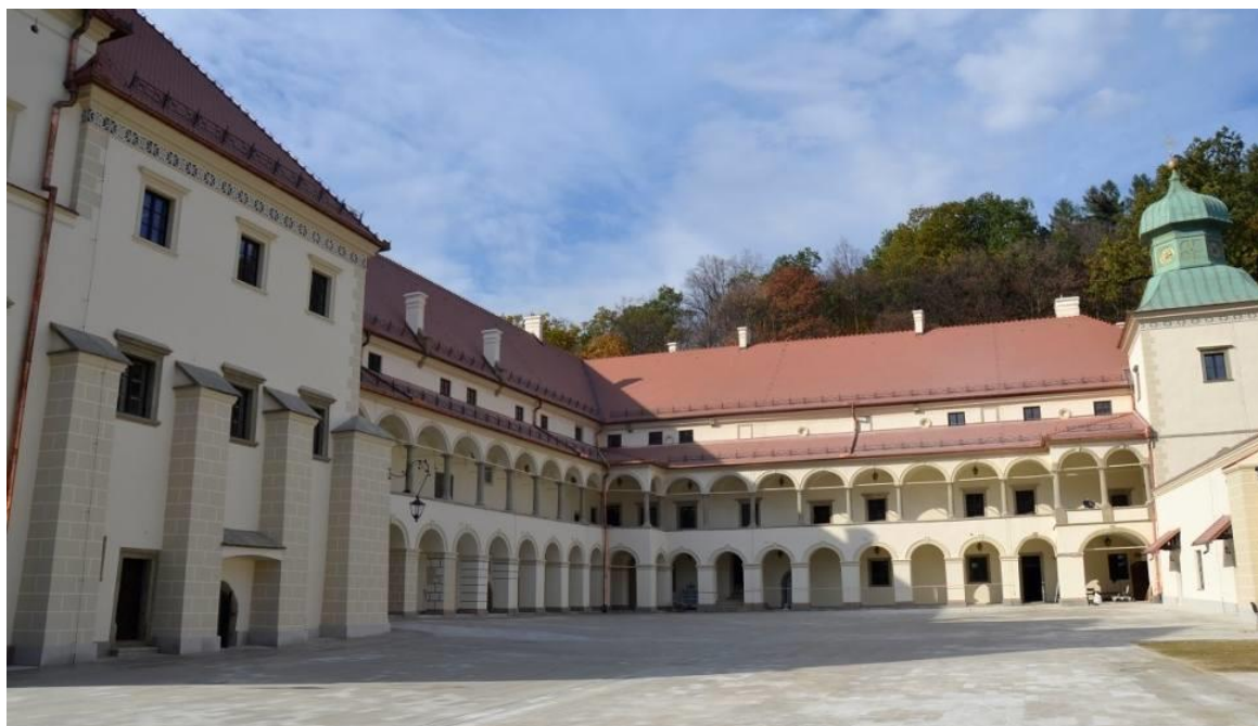
Zamek po remoncie (dziedziniec)