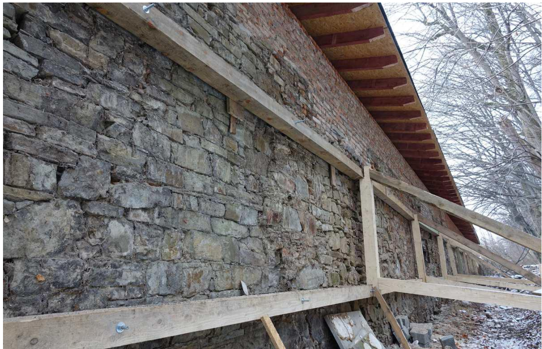
Oranżeria – mur od strony północnej po jego zabezpieczeniu