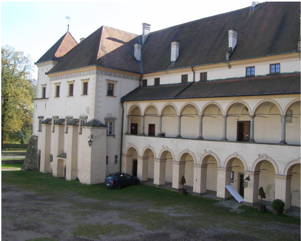
Zamek przed remontem (dziedziniec)