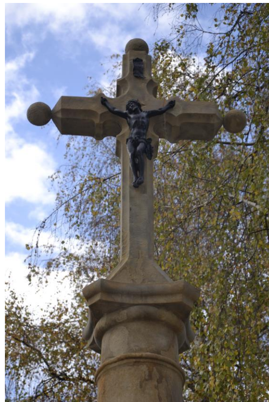
Krzyż po renowacji